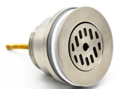
Abflussventil ø 62 mm Abflussrohr 1 1/4" Aussengewinde

HAUPTSITZ dade design AG Bafflesstrasse 37b 9450 Altstätten, Switzerland +41 71 511 26 72